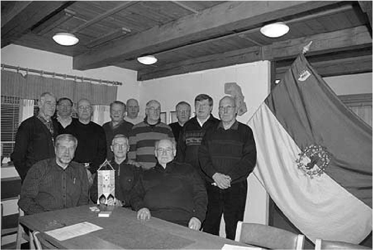
Loimaan seutukunnan väapelikerhon vuosikokous 2009.

- Osallistuttiin sotiemme sankarivainajien kunnianosoitukseen, lippumme kera, 17.5 Kanta-Loimaan sankarimuistomerkillä ja 6.12 Alastaron sankarimuistomerkillä.