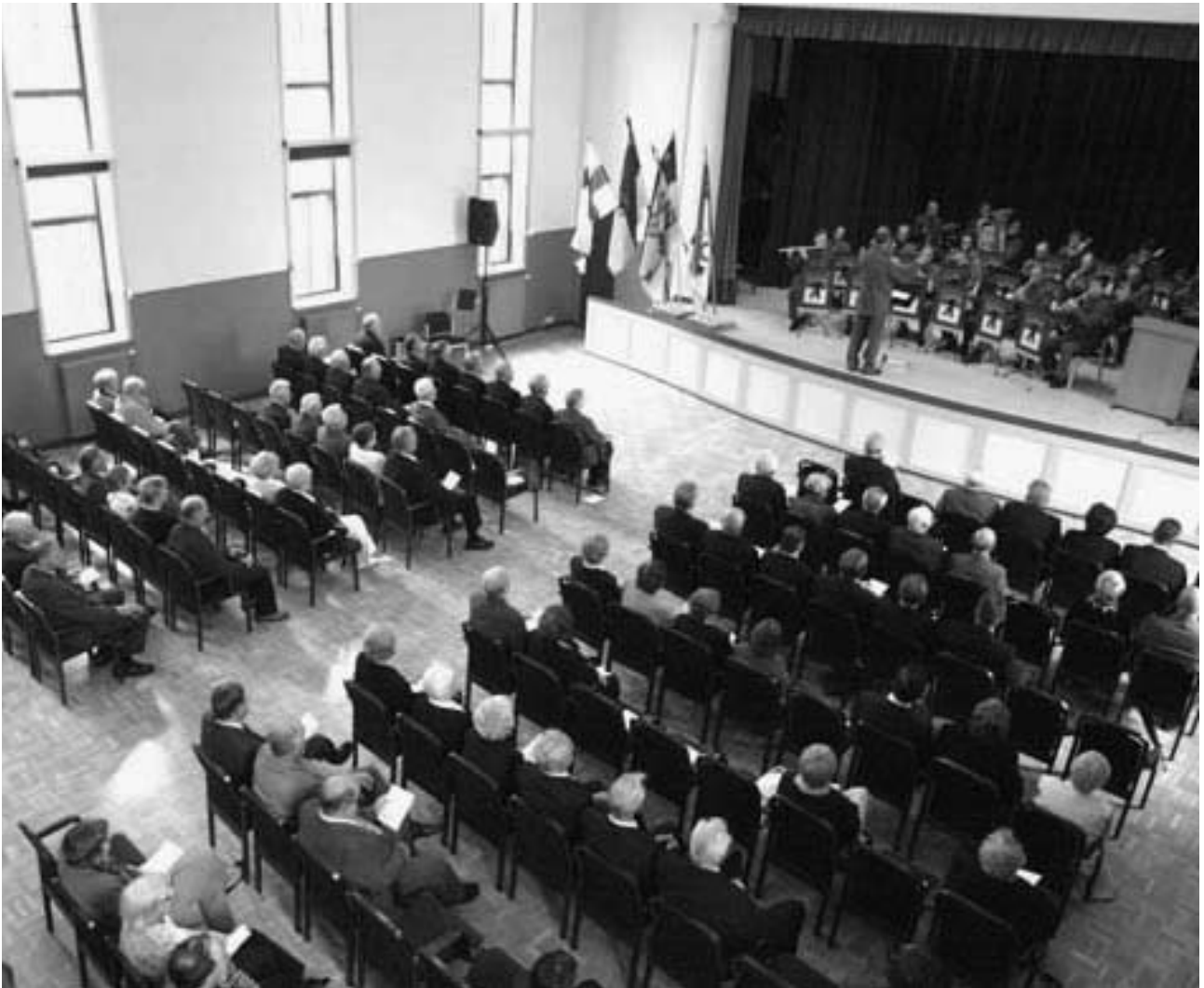
Maanpuolustusjuhla Loimaan Heimolinnassa.

- Porin Rykmentin - Porin Prikaatin kilta täytti 50 vuotta. Vuosijuhlaa vietettiin vuosikokouksen yhteydessä Huovinrinteellä. Aiemmin julkaistun 40-vuotishistorian jatkoksi julkaistiin 10 seuraavaa vuotta käsittävä historiikki ja historian molemmat osat sisältänyt CD-levy.