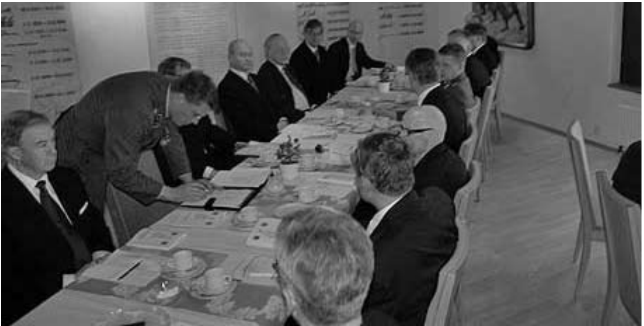
Killan valtuuskunta kokoontui runsaslukuisesti ennen vuosijuhlaa.