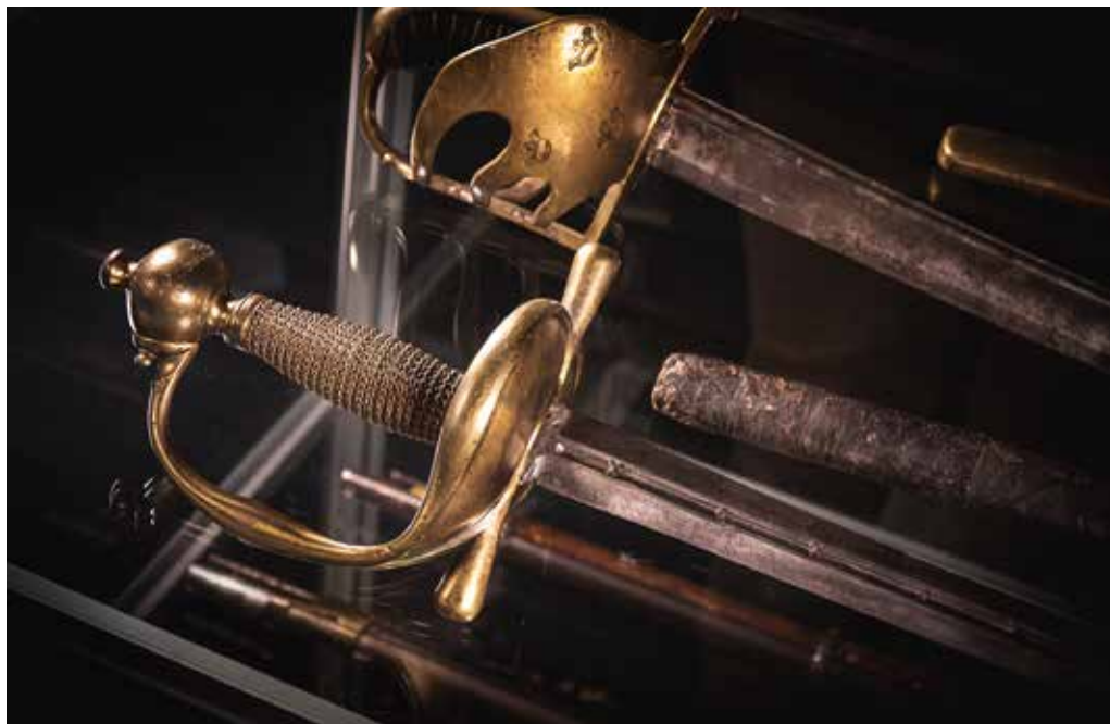
1700–1800-lukujen ruotsalaisia ja venäläisiä miekkoja.