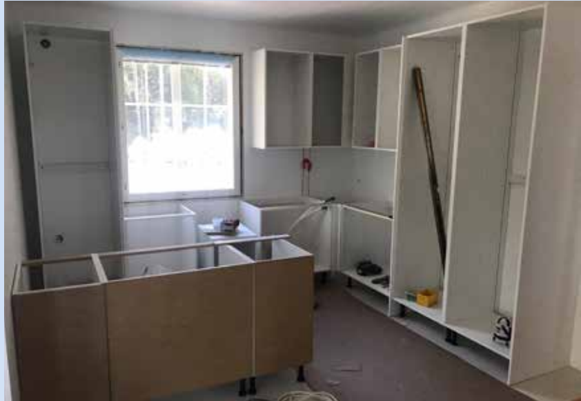
Tällä hetkellä aika ja energia menee uuden kodin rakennusprojektissa.

perustavia, ammatissa aloittelevia kiireisiä nuoria naisia ja miehiä. Uskon silti, että kiltatoiminnalle, maanpuolustukselliselle sosiaaliselle toiminnalle, on tärkeä paikka nyky-yhteiskunnassa ja myös tulevaisuudessa. Erityisesti kansakuntaa kurittanut koronaepidemia ja sosiaalisten kontaktien merkittävä rajoittuminen on tuonut mukanaan mahdollisuuden saada ihmiset liikkeelle ja tapaamaan toisiaan pitkän eristäytymisen päättyessä toivottavasti vielä tänä vuonna. Siksi haastankin kaikki kiltalaiset ideoimaan ruohonjuuritasolla alueosastoissa toimintaa, jolla yhteiskunnan auetessa voisimme elvyttää suomalaisten yhteisöllisyyttä ja yh-