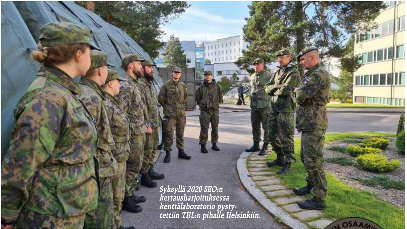
Syksyllä 2020 SEO:n kertausharjoituksessa kenttälaboratorio pystytettiin THL:n pihalle Helsinkiin.