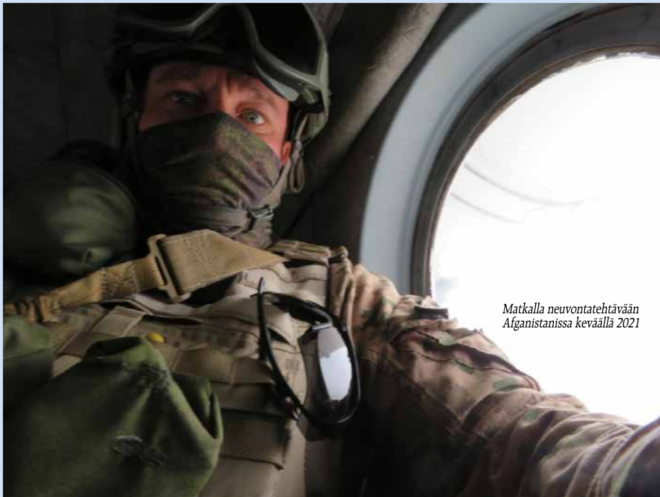
Matkalla neuvontatehtävään Afganistanissa keväällä 2021