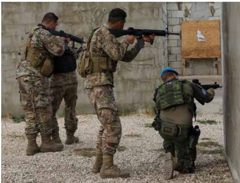
Rakennetun alueen taistelukoulutuksessa ( Fighting in Built-Up Area, FIBUA )

nyt, kun perinteisiä virkistysretkiä (Wellfare) ei ole vielä pystytty aloittamaan, on saunojen merkitys korostunut. Jokainen joukko voi myös kerran kuussa tilata grillattava koheesioiltaan, missä pystytään joukolla rentoutumaan. Suunnitelma on aloittaa myös virkistysmatkat tukikohdan ulkopuolelle hyviksi koettuihin lomakeskuksiin päiväreissuina heti, kun sää ja koronatilanne uudelleen taas sallivat.