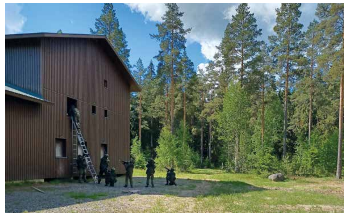
Taistelutekniikoiden kertaamista rakennetulla alueella..

Ase- ja ampumakoulutusta Säkylässä kesäkuussa 2022