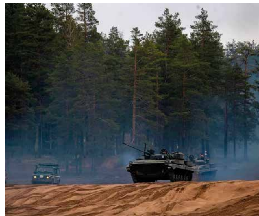
Vaunujen liikettä FTX1-vaiheessa Niinisalon Pohjankankaalla.

Säkylässä toteutettu taisteluharjoitus keräsi ansaittua kiitosta ulkomaalaisilta kumppaneilta. Brittien toimiva yksikön päällikkö oli todennut harjoituksen jälkeen, että "Arrow 22 -harjoituskokonaisuus oli paras harjoitus, jossa hän oli ollut yli kymmenvuotisen ammattisotilasuransa aikana". Erityistä ihailua keräsi varusmiesten ammattitaito taktisen osaamisen ja johtamiskyvyn näkökulmasta. Huolimatta siitä, että varusmiehillä koulutusta on takana vasta muutamia kuukausia, oli heidän osaaminen erittäin korkealla tasolla jopa verrattuna ulkomaisiin ammattisotilaisiin. Harjoituksessa käytetty komen-