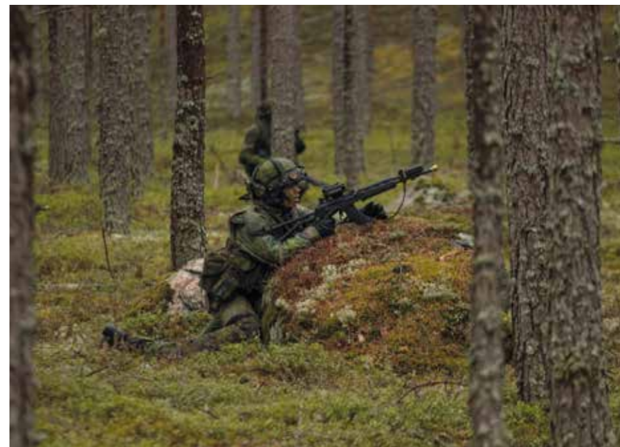
Jalkaväki etenee Säkylässä harjoituksella.

tokieli oli englantilainen ja tälläkin saralla varusmiehet ja henkilökunta selvisivät esimerkiksi.