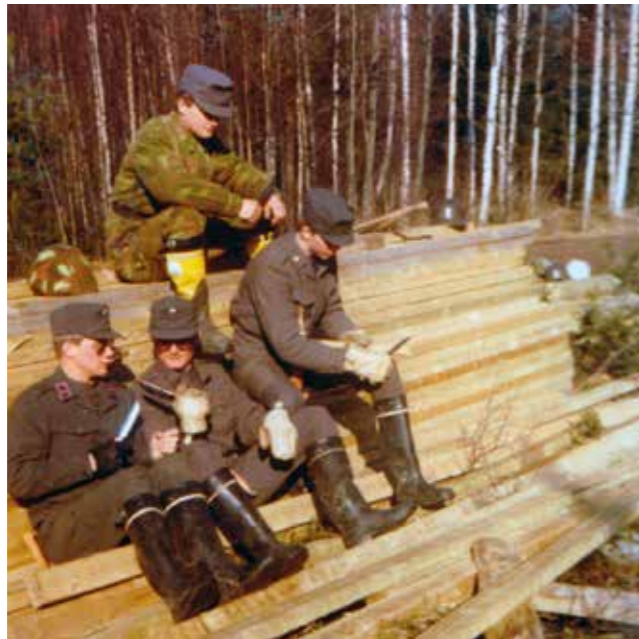
Loppusota komennuksena tiehoitokunnan sillanrakennustyömaalla.

rantaan. Ajoin koko päivän syöksyveineitä. Meni 40 litraa bensaa. Hieno päivä ajella pikkumustat jalassa ja aurinkolasit päässä. Saatu paketti Helsingistä. Yö saarella. Illalla nuotion ääressä pystyssä ollessani, yhtäkkiä yksi pioneeri (lähti Kaartiin aika pian tämän jälkeen) yritti napata puukkonni tupesta. Ennen kuin itsekään tajusin tapahtunutta, olin heittänyt kaverin judoheitolla ketoon. Eipä ole aikoihin lähtenyt niin nopeasti. Katselin itsekin tapahtunutta mitten mukana haavi auki. Reaktio pelaa. Mahtavaa. Tapaus kuitattiin hyvällä naurulla ja kättä paiskaamalla.