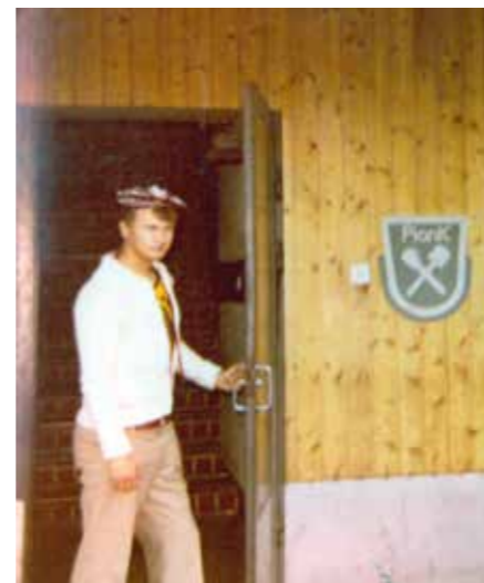
Ovi kiinni ja siviiliin.

Seuraavaksi päästiin siviiliin ja illalla lensivät hylsyt, vielä Turun Seurahuoneen parketillakin!