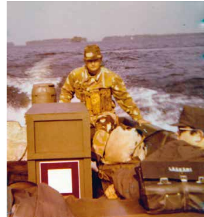
Kuskina syöksyveneleirillä Säkylän Pyhäjärvellä

Kovassa aallokossa 40 solmun nopeudella kiitävässä veneessä istuminen kysyy mieheltä kuin mieheltä hyvää yleiskuntoa sekä vahvaa ja rautaista luonnetta. Porin Prikaatissa annettiin silloinparille kymmenelle varusmiehelle "kuoppaisella" Säkylän Pyhäjärvellä syöksyveneen kuljettajan koulutusta, ja olot olivatkin koulutusta ajatellen mitä parhaimmat: Tuulta ja tuiverrusta on järvellä riittänyt auringonpaisteen lomassa sopivasti. Koulutuspaikkoina ovat Puolustusvoimien omistama saari, jossa annetaan teoriakoulutus, sekä Pyhäjärven laaja ulappa. Syöksyvenettä kuljetetaan monenlaisissa oloissa: vahvasti kuormattuna tai täysin tyhjänä. Näin kuljettajat oppivat nopeakulkuisen veneen käyttäytymisen varsin tarkoin, kertoi koulutusta johtanut lähin esimieheni sotilasmes-