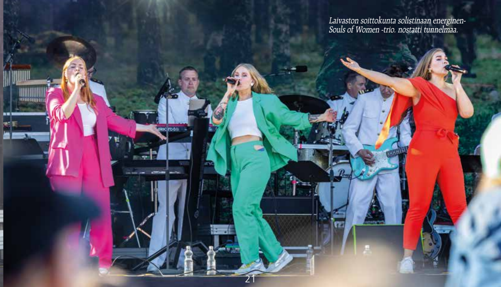
Laivaston soittokunta solistinaan energinen Souls of Women -trio, nostatti tunnelmaa.