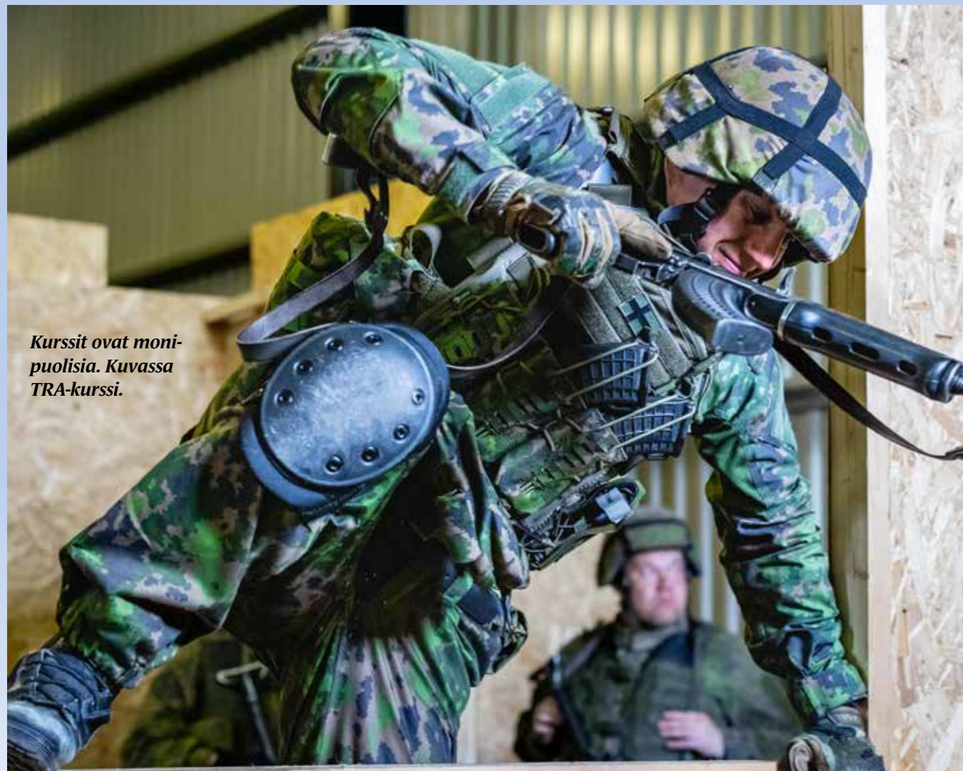
Kurssit ovat monipuolisia. Kuvassa TRA-kurssi.