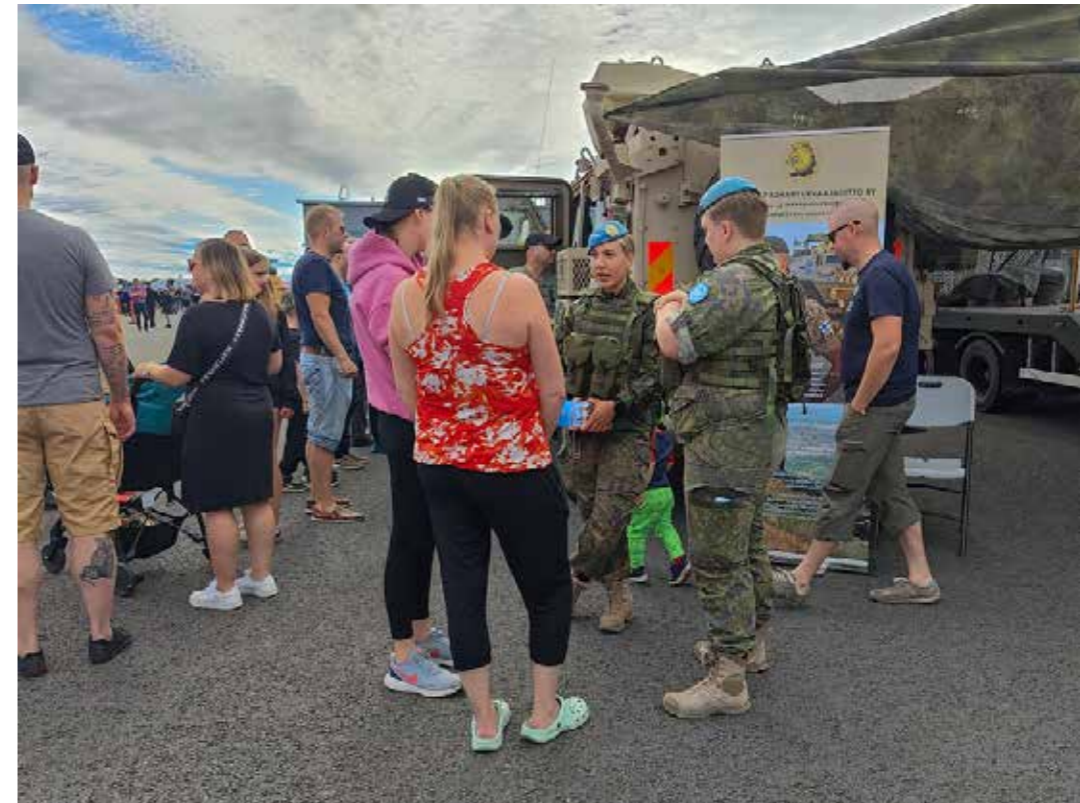
Suomen Rauhanturvaajaliiton esittelypisteestä vastasi Pohjanmaan rauhanturvaajat. Esittelypiste veti puoleensa paljon rauhanturvaamisesta kiinnostuneita.

uusia jäseniä alueellisiin jäsenyhdistyksiin. Suomen Rauhanturvaajaliiton osastolta sai myös asiantuntevaa vertaistuki eli VETU -asiaa. SRTL on vahvasti mukana KRIHA -operaatioista kotiutuvien tukena muun muassa täällä koti-Suomessa arjen aloitukseen liittyen.