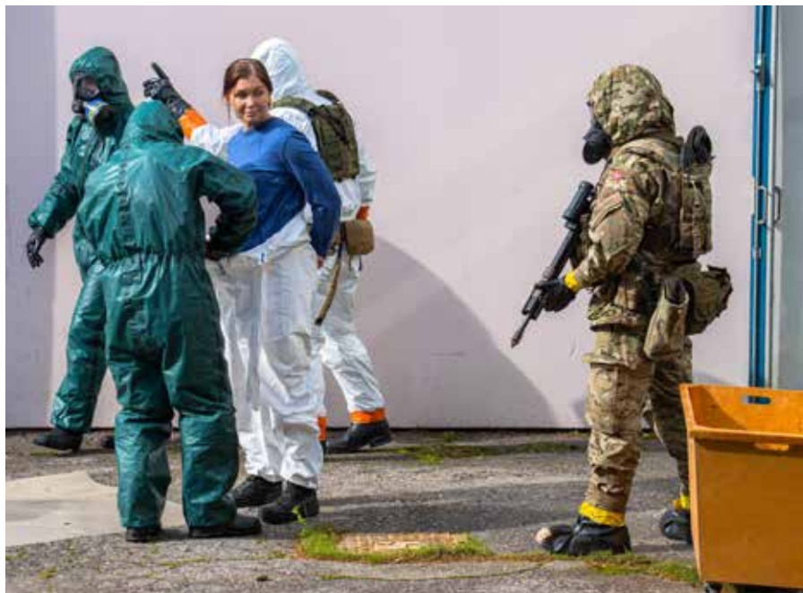
Yhdessä harjoitteessa tehdasalueelta löytyi maalimiesten kuvaamien ”rikollisten” hallussa ollut laboratorio, joka neutralisoitiin pohjoismaisen CBRN-joukkueen, Poliisin ja Rajavartiolaitoksen yhteistyöllä.

IEDD uhkia vastaan operoimista mahdollisimman realistisesti. Harjoitustilanteet luotiin todellisten uhkamallien ja maailmalta lähivuosina saatujen havaintojen perusteella ja harjoituskohteiksi valittiin todellisia paikkoja eikä harjoitusalueen syrjäistä metsää. Tästä syystä harjoitus näkyi laajasti kansalaisille mm. Helsingissä, Espoossa, Vantaalla, Tampereella, Turussa ja Porissa. Realismia haettiin myös sillä, että harjoituskohteissa operoi juuri niitä viranomaisia ja muita toimijoita, jotka kyseiseen tilanteeseen hälytettäisiin todellisuudessa paikalle tai keneen oltaisiin yhteydessä. Lisämausteen joukoille toi vielä se, että harjoitukseen kulumattomat sivulliset tuli huomioida tilannepaikalla, kuten todellisessakin tilanteessa tulisi tehdä.