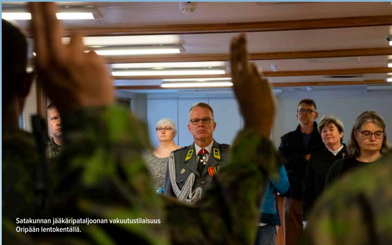
Satakunnan jääkäripataljoonan vakuutustilaisuus Oripään lentokentällä.