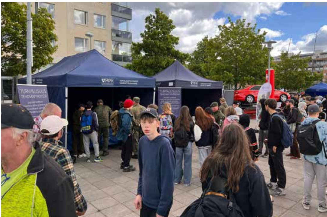
Maanpuolustus on välillä näkyvästi esillä katukuvassa.