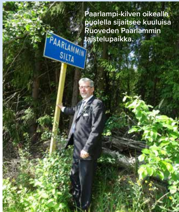
Paarlampi-kilven oikealla puolella sijaitsee kuuluisa Ruoveden Paarlammien taistelupaikka.