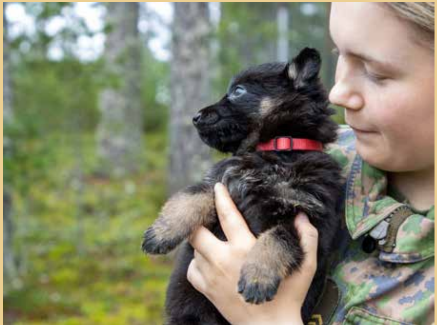
Sotakoiraopentu tutustumassa ulkoilmaan