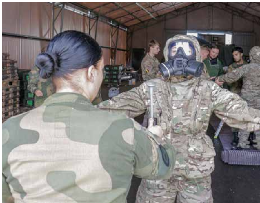
CET/FIT vaiheessa yhdenmukaistettiin mm. puhdistuslinjastolla toimiminen.

huoltojoukkue. Alun harjoitus- ja turvallisuuspuhutteluiden jälkeen joukoilla oli kolme päivää aikaa hankkia operointikyky tuleviin tehtäviin Combat enhancement ja force integration vaiheessa (CET/FIT). Operointikyvyn saavutettuaan (full operational capability, FOC) joukot kykenivät aloittaa harjoituksen tärkeimmän ja vaativimman eli Live exercise (LIVEX) vaiheen. LIVEX-vaihe kesti kuusi päivää ja sen aikana komppania toteutti saamiaan tehtäviä tilanteenmukaisesti oman suunnittelun ja päätöksien mukaisesti. Joukot suorittivat yhteensä 16 isoa