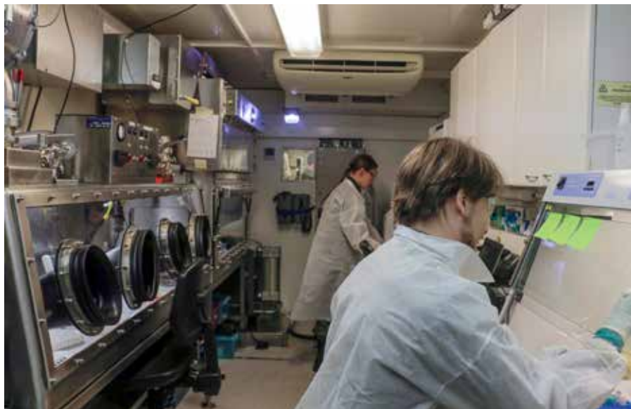
RecceX 23 -harjoituksessa kenttälaboratorio toimi osaavien reserviläisten voimin

Harjoituksen alussa Suojelun erikoisosasto perustettiin ja ulkomaiset joukot sekä Raivaamisen erikoisosasto keskitettiin Säkyliään. Harjoitusjoukosta muodostettiin monikansallinen CBRN komppania, josta löytyi kolme CBRN joukkuetta, kenttälaboratoriojoukkue sekä komento- ja