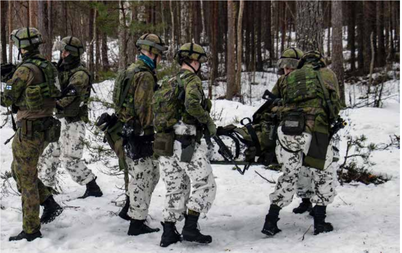
Varusmiehiä harjoittelemassa haavoittuneen henkilön evakuoimista.

Taisteluensiapu on jokaisen sotilaan perustaito. Evakuoinnin yhteydessä potilaan loukkaantumiseen tai haavoittumiseen liittyvät tiedot kirjataan ylös. Tietojen perusteella lääkintähenkilöstö kykenee heti aloittamaan välittömät toimenpiteet vammojen hoidossa.