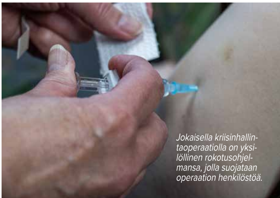
Jokaisella kriisinhallintaoperaatiolla on yksilöllinen rokotusohjelmansa, jolla suojataan operaation henkilöstöä.

SOTLK:n terveydensuojelu- ja lääkintätiedustelusektorin eläinlääkäri valvoo suomalaisten kriisinhallintajoukkojen elintarvike-, talousvesi- ja asumisturvallisuutta samaan tapaan kuin terveystarkastajat kunnissa. Käytännössä tätä tukea annetaan operaation huollolle ja lääkinnälle etänä puhelimitse tai sähköpostitse, mutta myös suunnitelmallisilla tarkastuskäynneillä operaatioihin. KRIHA-operaatioissa ympäristön, elintarvikkeiden tai vaikkapa hämähäkieläinten ja hyönteisten aiheuttamat riskit voivat olla toista luokkaa kuin koti-Suomessa. Tästä syystä SOTLK:n eläinlääkärit myös