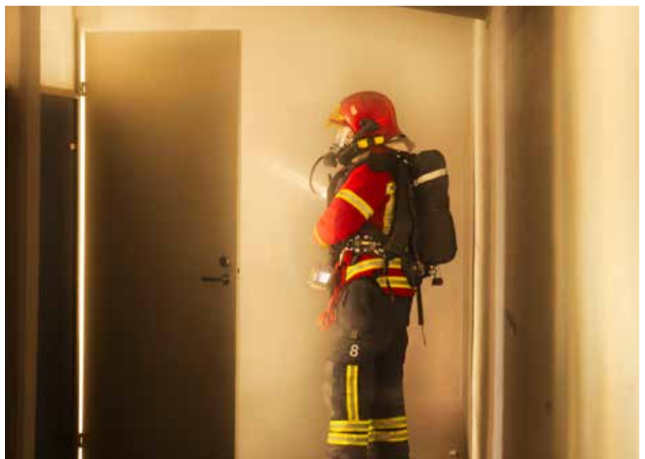
Varsinais-Suomen pelastuslaitos osallistui Lounais-Suomi 24 -paikallispuolustusharjoitukseen.