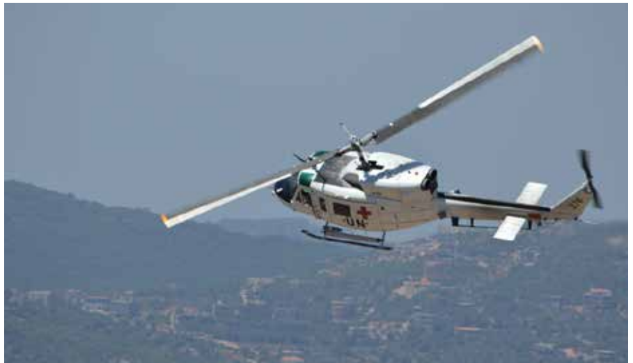
Koulutuksen tavoitteena on, että henkilöstö ja joukko kykenevät aloittamaan käsketyt tehtävät alueella tapahtuvan perehdytyksen jälkeen. Operaatioissa jatketaan tarvittavalla täydennyskoulutuksella.

Terveydensuojelu- ja lääkintätiedustelusektorin päätehtävä on ennal-