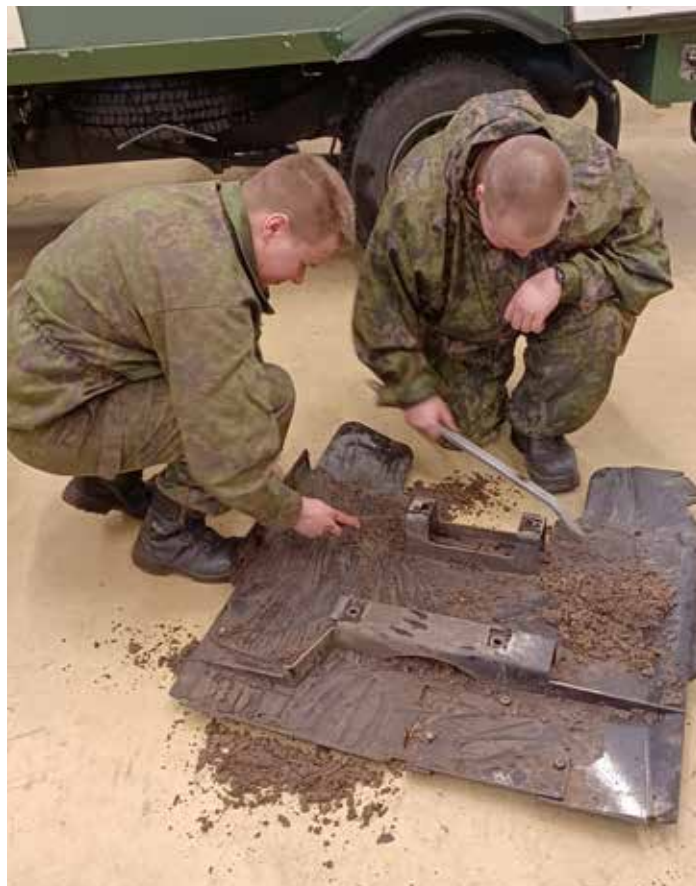
Perusteellinen puhdistaminen vaatii huolellisuutta ja tarkkuutta sekä tarvittaessa ajoneuvon eri osien irrottamista puhdistusta varten.

Tarve puhdistustoiminnalle tulee ottaa huomioon jatkossa myös pesupaikkoja suunniteltaessa, jotta myös ajoneuvon alustan puhdistaminen ja tarkastaminen on helppoa ja turvallista. Kansainväliset harjoitukset ovat yhä tavanomaisempaa arkipäivää myös Porin prikaatissa, joten on hienoa, että meillä on ymmärrystä ja osaamista ajoneuvokaluston bioturvallisuuteen liittyvästä puhdistustoiminnasta.