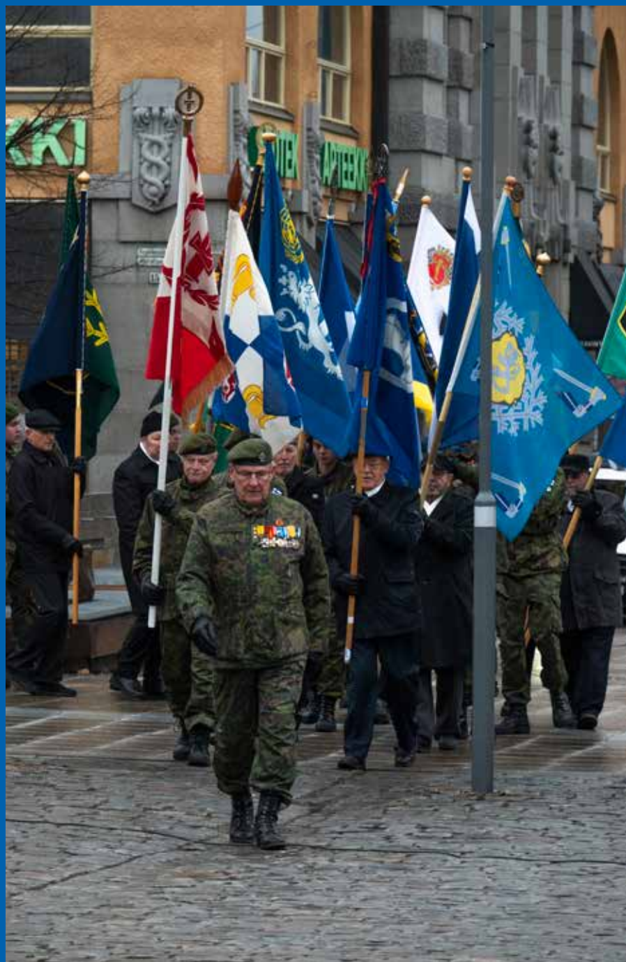
Aamu alkoi juhlallisella lipunnostolla Vaasan kauppatorilla ja seppeleenlaskulla Suomen vapaudenpatsaalle.

Juhlapäivä oli kokonaisuudessaan isänmaallinen ja erittäin lämminhenkinen. Päivän sää oli kylmä ja räntäsateinen, mutta se ei juhlatunnelmaa vähentänyt. Vaasan kaupunki oli tapahtuman vastuullinen järjestäjä, jolle Porin prikaati, erityisesti Pohjanmaan aluetoimisto ja Pohjanmaan jääkäripataljoona, antoivat vahvan tuen.