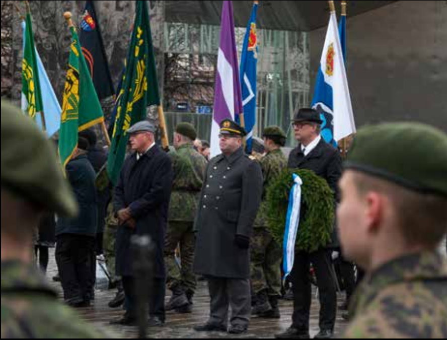
Sepeleenlasku Suomen vapaudenpatsaalle, Vaasan kauppatori.