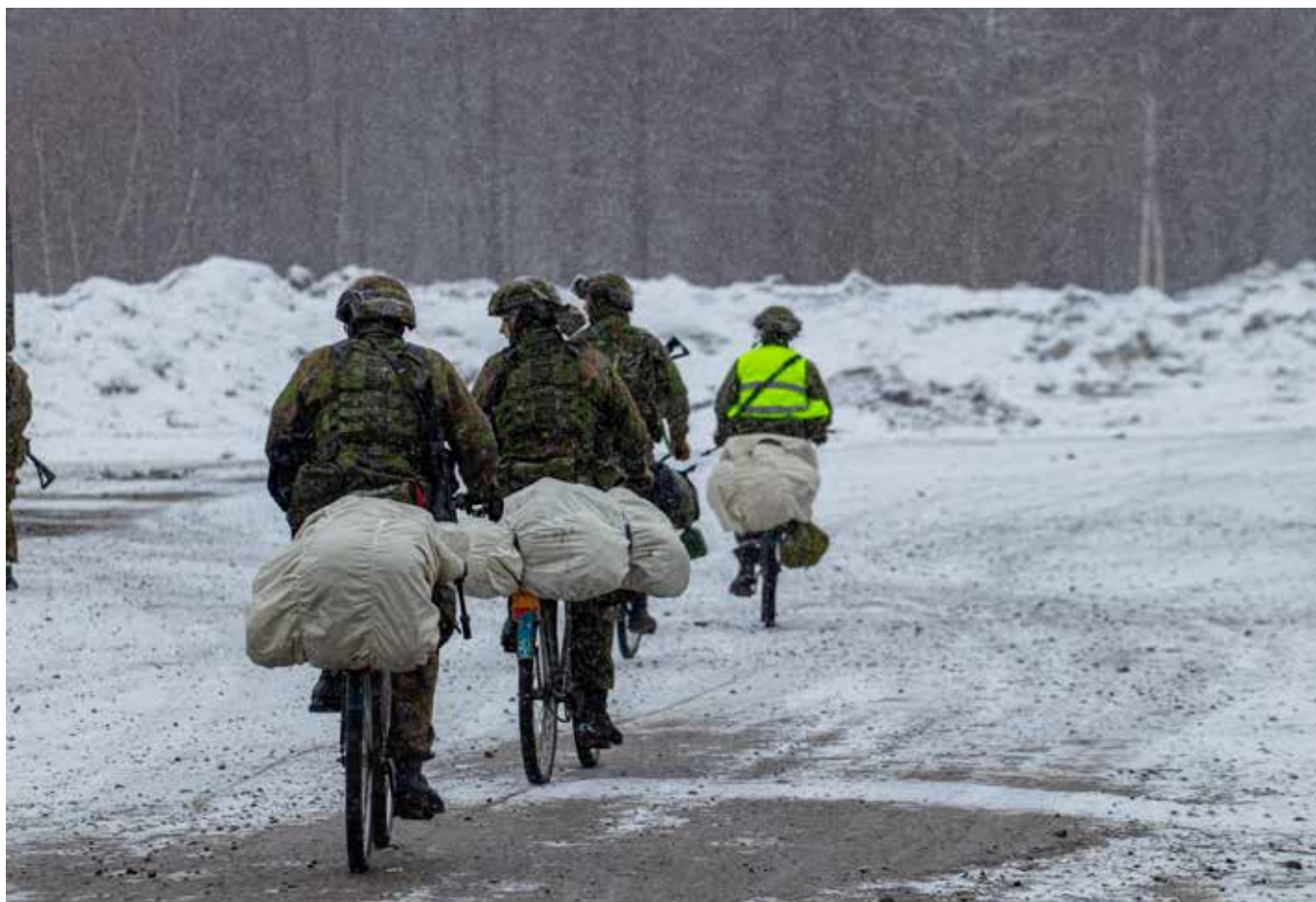
Huhtikuinen lumisade toi lisämausteen kokeen lähtöpäivään.

tävissä tarvittavia taitoja. Vaikka varusmiehet olivat saaneet vähäisesti unta ja olivat väsyneitä pitkän pyöräilypäivän jälkeen, he silti toimivat tehokkaasti. Monet yhä hymyilivät ja näyttelivät peukkua hyvän asenteen merkiksi. Rasteja suoritettiin aamusta myöhään iltaan asti, minkä jälkeen marssijat pääsivät jälleen lyhyeen lepoon ennen kokeen viimeistä päivää. Ryhmät aloittivat jo yöllä pitkän jalkamarssiosuuden ja tässä vaiheessa marssijoista alkoi näkyä uupumus, mutta samalla jokaisen silmistä paistoi myös taistelutahto. Vaikkakin unet olivat jääneet vähäisiksi, matkat olivat pitkiä ja rastit haastavia, jaksoi kaikki silti painaa yhdessä eteenpäin. Rasteille saapuesssa ryhmäläiset kannustivat toisiaan jaksamaan loppuun asti.