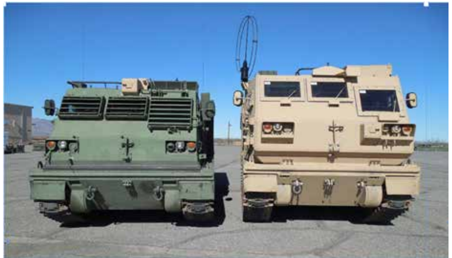
Vasemmallä vanhan mallinen raskas raketinheitin ja oikealla uusi A2-versio.