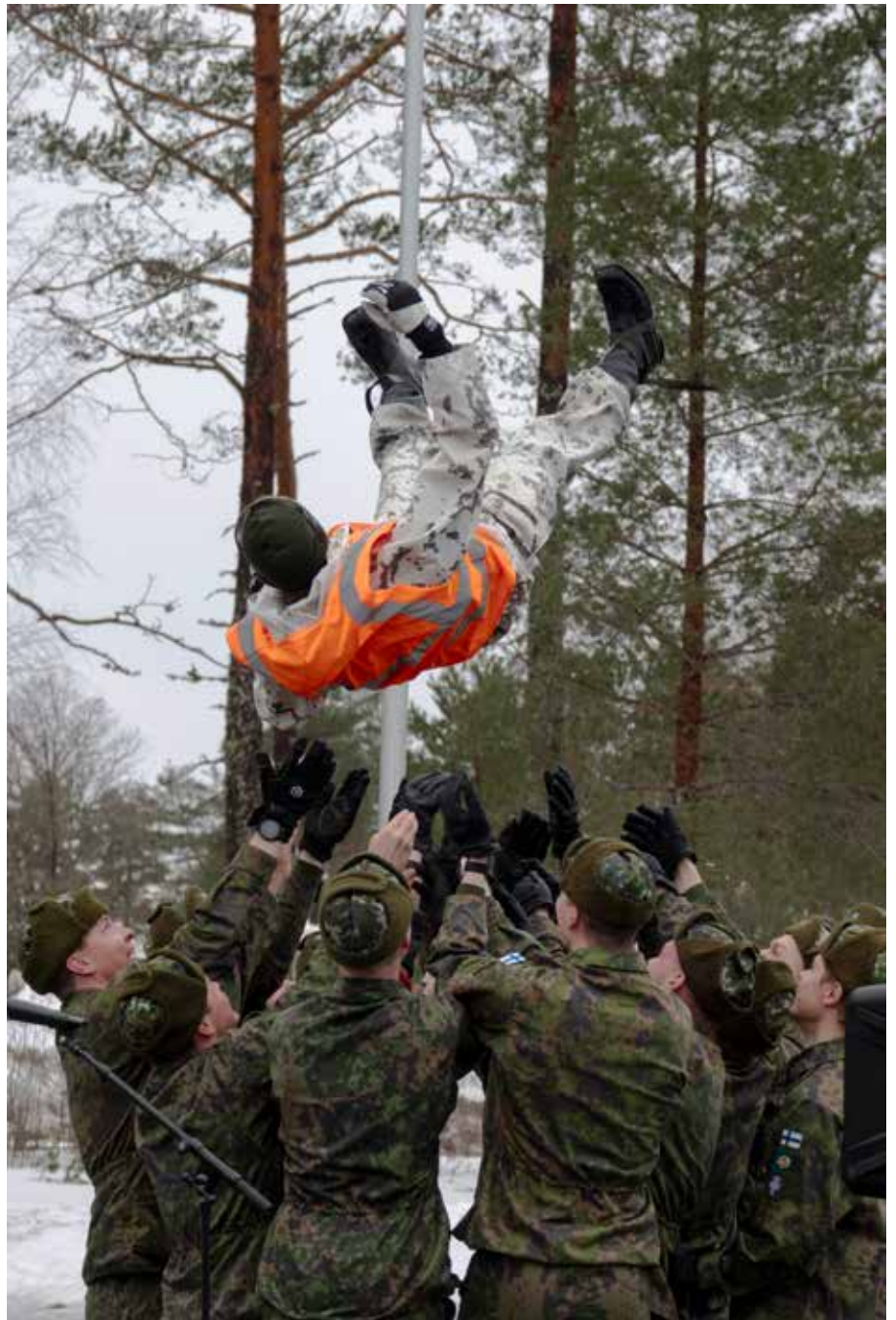
Oltermanniin valmistautumista suunnittelun merkeissä.

Oltermanni 2025 järjestämisvastuu on Maasotakoululla.