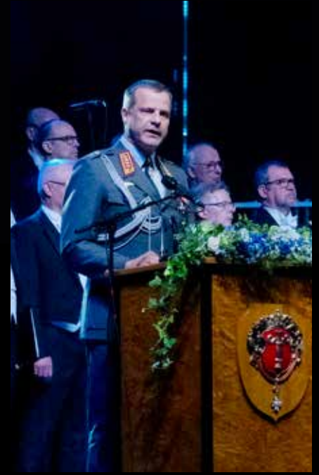
Puolustusvoimain komentaja kenraali Janne Jaakkola toi tervehdyksen.