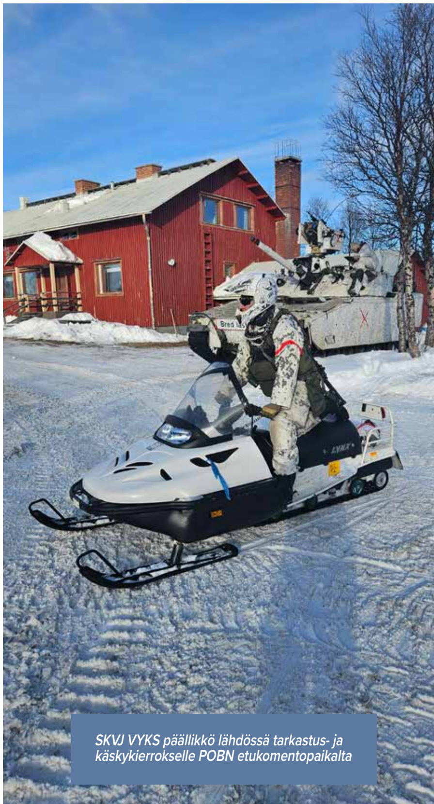
SKVJ VYKS päällikkö lähdössä tarkastus- ja käskykierrokselle POBN etukomentopaikalta