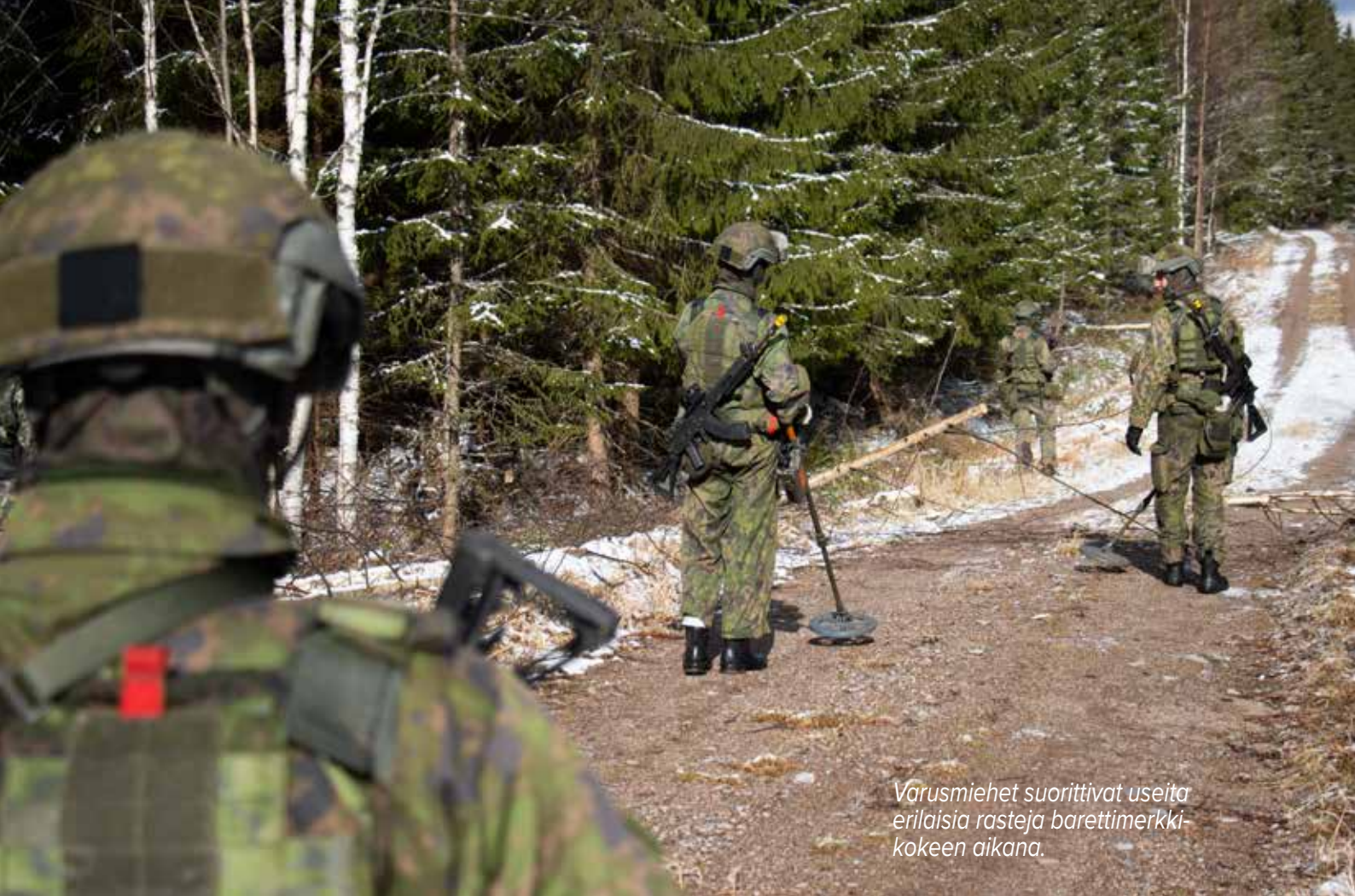
Varusmiehet suorittivat useita erilaisia rasteja barettimerkkikokeen aikana.