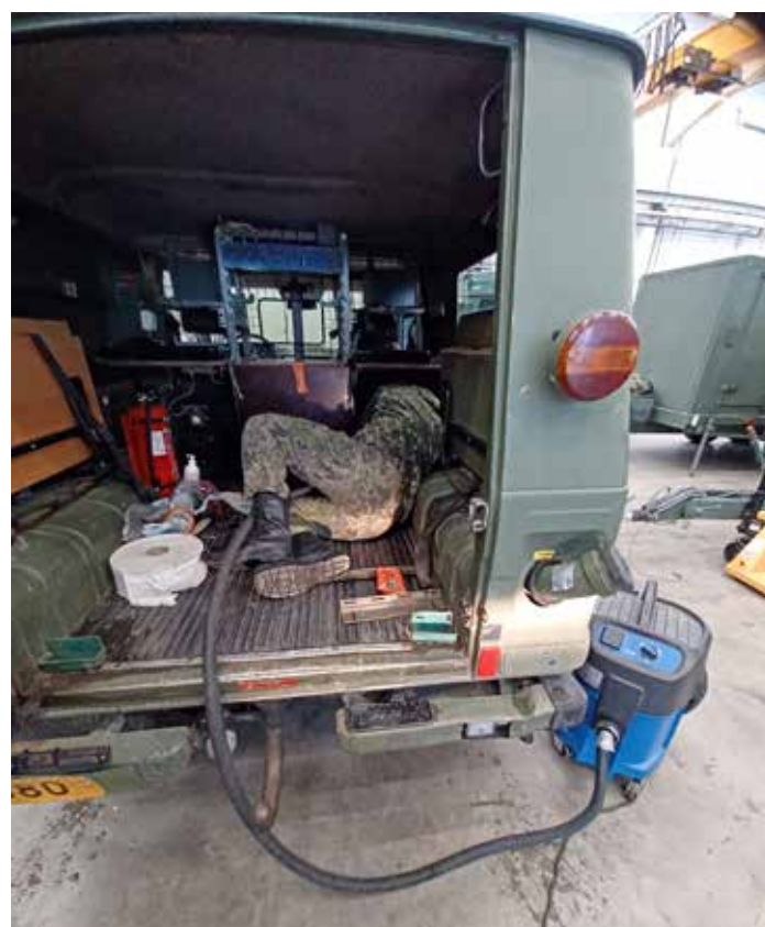
Pelkkä ulkoinen puhdistaminen ei ole riittävää bioturvallisuuden näkökulmasta. Ajoneuvot tulee puhdistaa myös sisätilojen osalta.