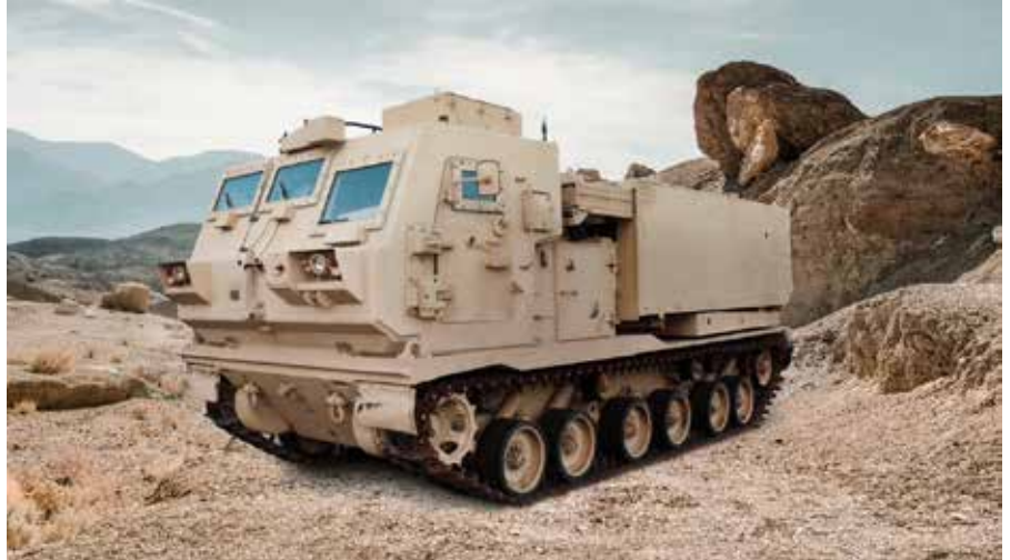
Uusi M270A2- raketinheitin.

Päivityksen toteuttaa yhdysvaltalainen Lockheed Martin.