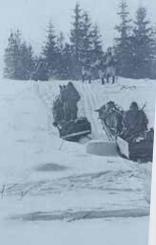
PORIN PRIKAATIN J RYKMENTIN KILLA