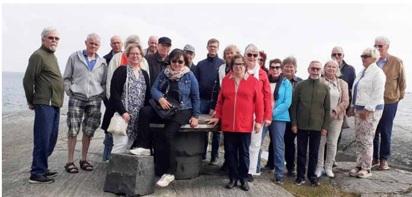
Hangon retkeläisiä kahvila Neljän Tuulen Tuvan kallioilla.