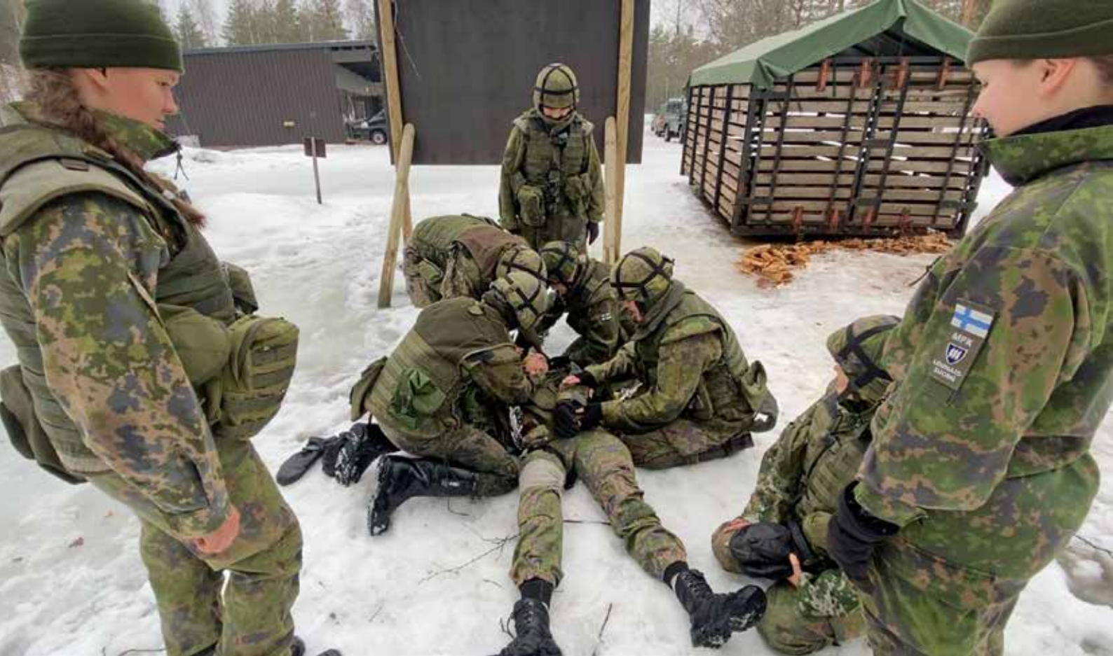
Sotilaan perustaitoja kouluttamassa MPK:n kurssilla.