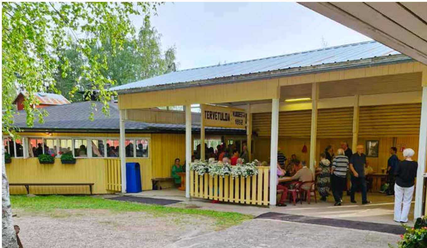
Porilaistanssien tunnelmaa Laurilan lavalla.