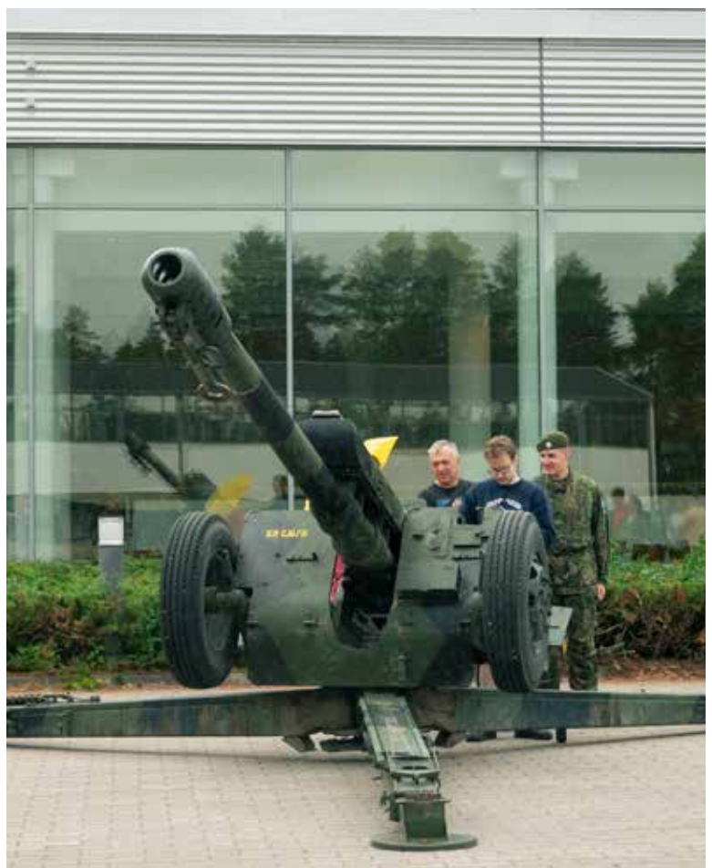
Kenttätykkistön 122 H 63 -tykki oli näytillä läheistenpäivänä Niinisalon varuskunnassa.