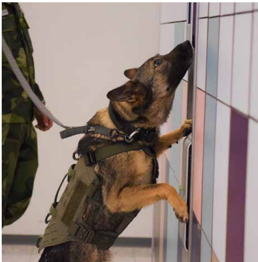
Räjähdekoirat tekivät kurssin aikana etsintäharjoituksia ohjaajiensa kanssa esimerkiksi kauppakeskuksessa.