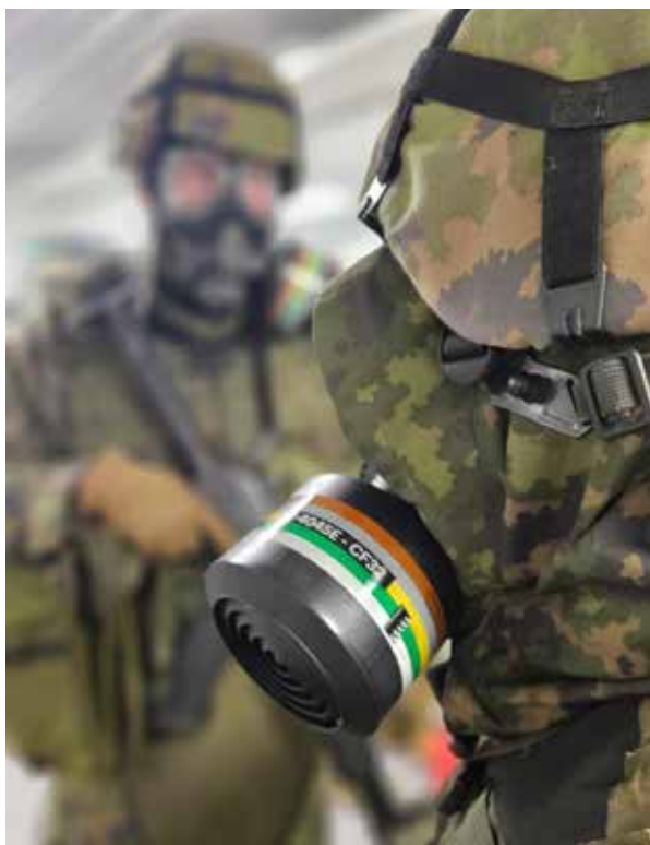
Taistelukoulutuksessa aiheena oli suojautuminen CBRN-aseilta

pu on sisältänyt rastikoulutusta ja johtajakoulutusta, mutta myös paljon tutustumista ja ryhmäytymistä.”