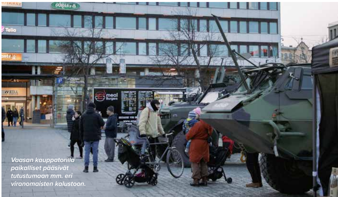
Vaasan kauppatorilla paikalliset pääsivät tutustumaan mm. eri viranomaisten kalustoon.