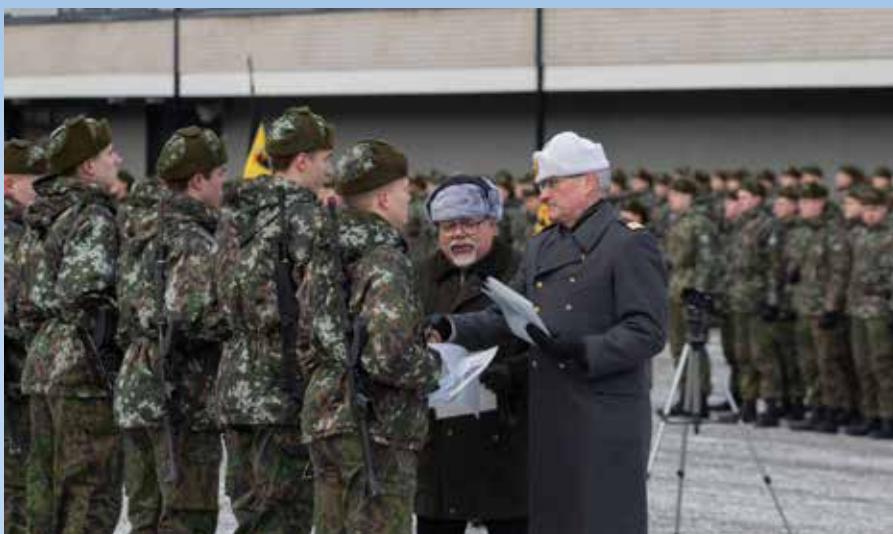
Jokaisesta yksiköstä palkittiin karkitaistelija Turun Seudun Kodinpuolustus säätiön myöntämällä stipendillä, kunnia-kirjalla sekä yhden vuorokauden kuntoisuuslomalla.