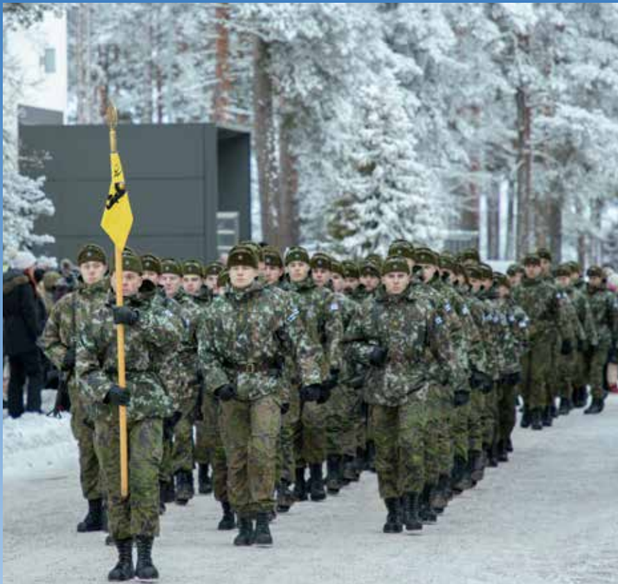
Tunnelmia Niinisalon ja Säkylän sotilasvalasta.